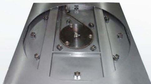
SONIC LPX ▶