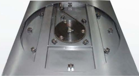
SONIC LPS ▶