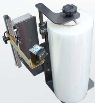
ROCKET LP ▶