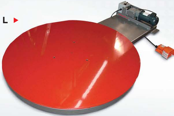
ROCKET L ▶