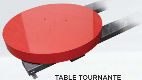
TABLE TOURNANTE AVEC DIAMETRE DE 59PO