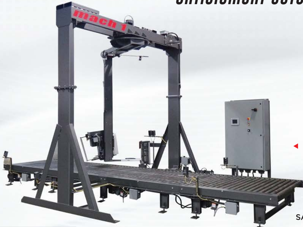
◀ DYNAMIC RT

MODÈLE DÉMONTRÉ SANS CLOTURE DE SÉCURITÉ